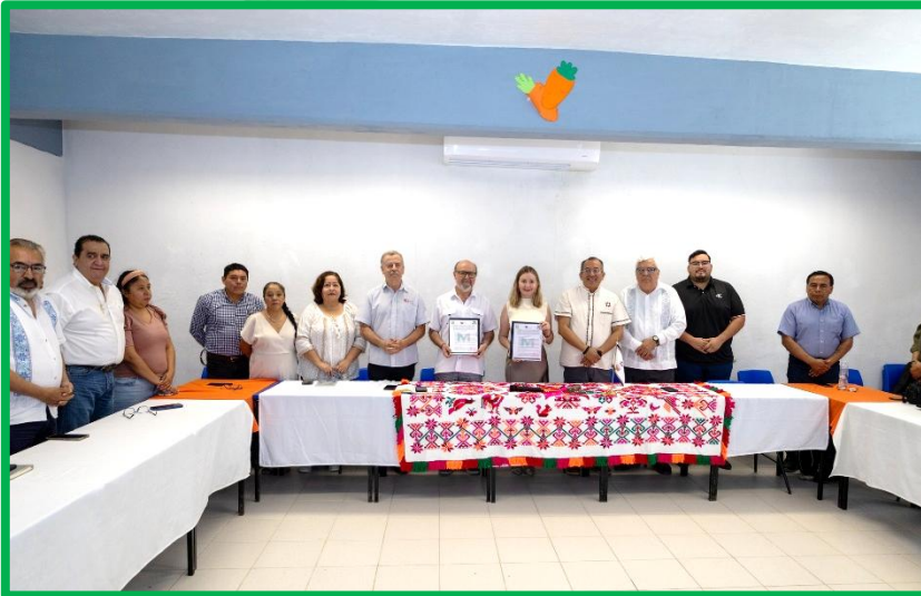
FIRMA DE UN CONVENIO DE COLABORACIÓN TRASCENDENTAL CON EL COLEGIO DE SAN LUIS A.C. (COLSAN)