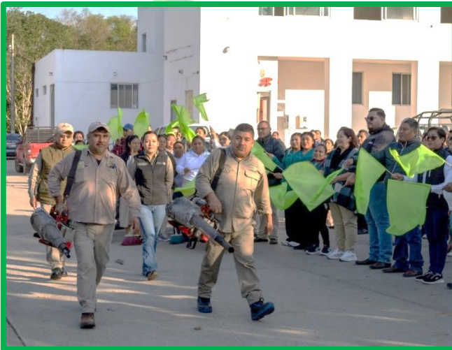
ARRANQUE DE PROGRAMA DE SANEAMIENTO BÁSICO EN EL MUNICIPIO.