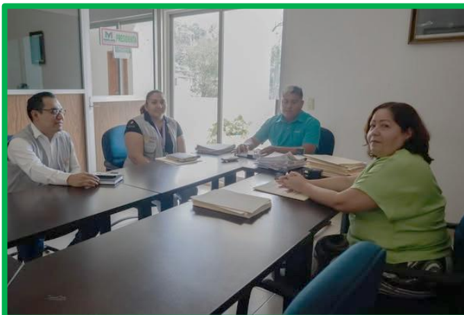
VISITA DEL SERVICIO NACIONAL DE SALUD PÚBLICA