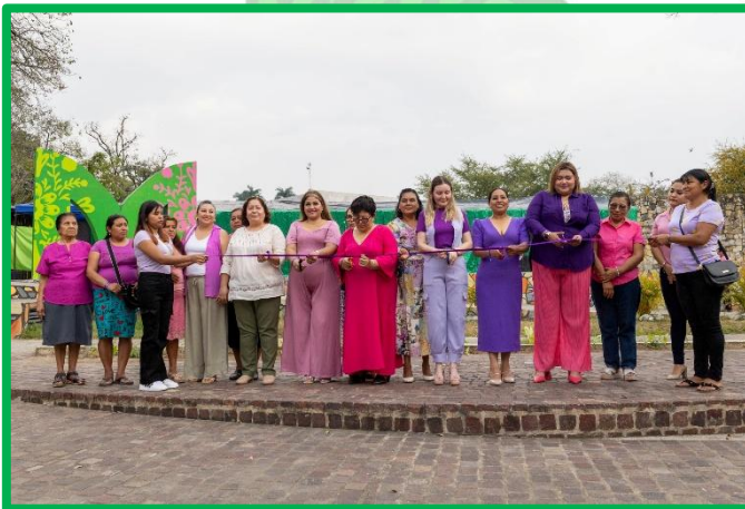
INAUGURACIÓN DEL “MERCADITO DEL EMPODERAMIENTO”