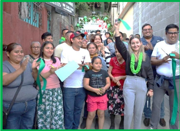
INAUGURACIÓN DE OBRA PROGRAMADA DENTRO DEL EJERCICIO 2025.