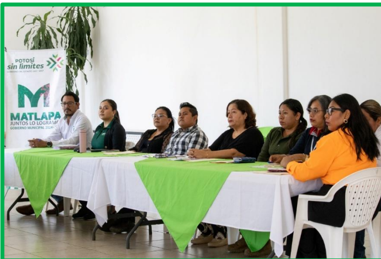
REUNIÓN DE CONSEJO DE SEGURIDAD PÚBLICA.