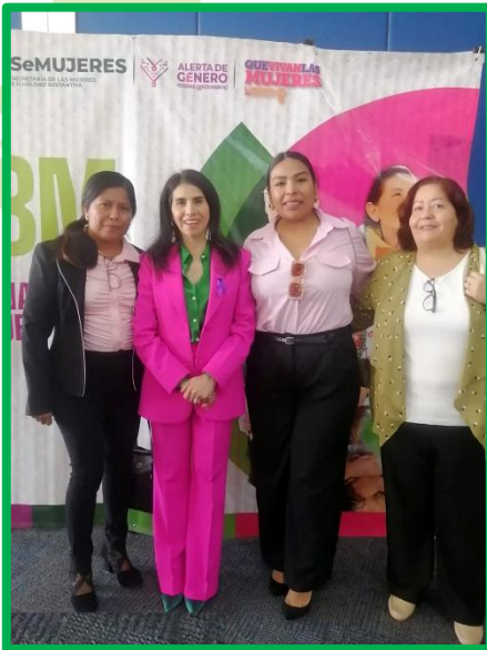
EVENTO DE ENTREGA DEL RECONOCIMIENTO “POTOSINA DEL AÑO 2026”