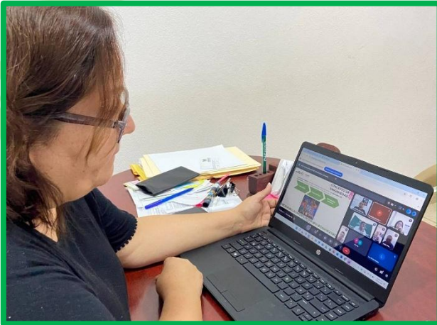
CURSO VIRTUAL “ATENCIÓN A LA SALUD CON UN ENFOQUE INTERCULTURAL”