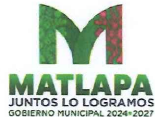
Cédula de Presupuesto Basado en Resultados (PbR)