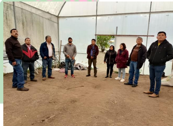
Evidencia 4.- Revisión de Vivero para el desarrollo del proyecto de Acuaponía.