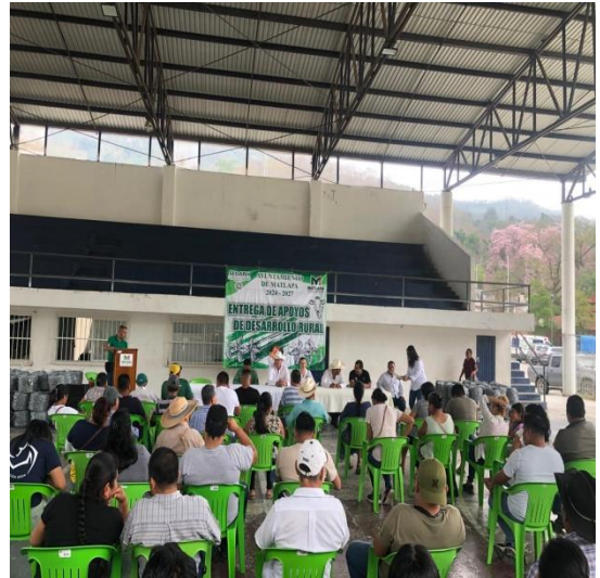
Evidencia 2: Apertura del evento de entrega de Alambre de Púas.