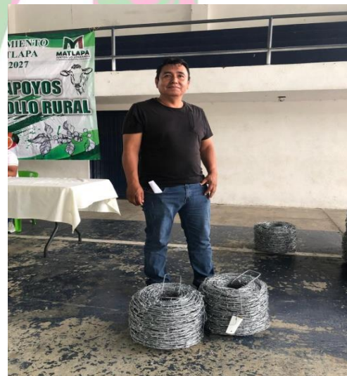
Evidencia 4: Entrega de Alambre de Púas.