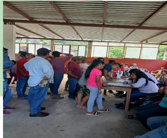
Evidencia 4. – Conformación del Comité de Cítricos en Zacayo.