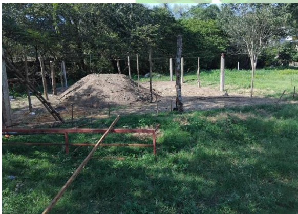
Evidencia 3: Trazabilidad y toma de medidas.