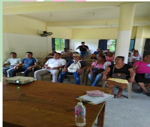
Evidencia 4: Capacitación en Comunidad Aguacatitla