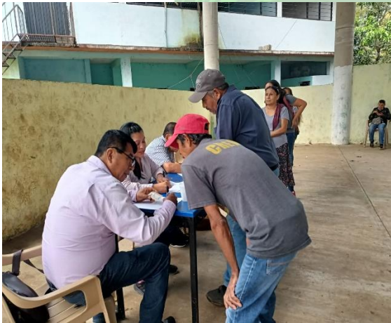
Evidencia 3. – Conformación del Comité de Cítricos en Cuaquentla.