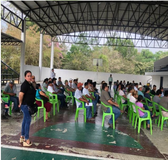
Evidencia 1: Recepción personas beneficiadas.