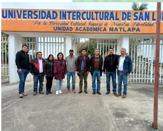
Evidencia 3.- Presentación del Proyecto de Acuaponía a la UICSLP.