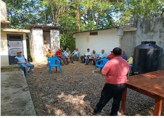
Evidencia 1. - Aplicación Del CENSO Agropecuario en Chalchitepetl.