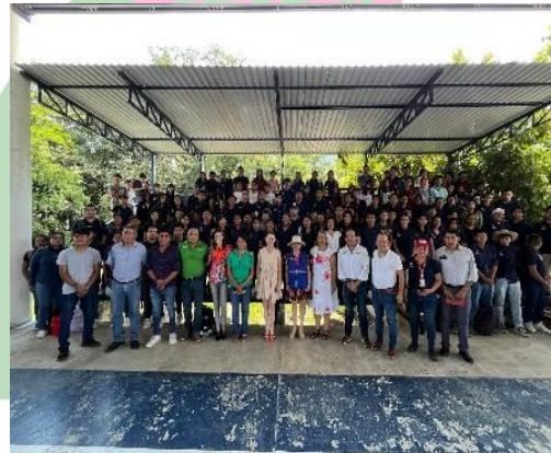
Evidencia 4: Asistencia de alumnos de UICSLP Unidad Académica Matlapa, S.L.P.