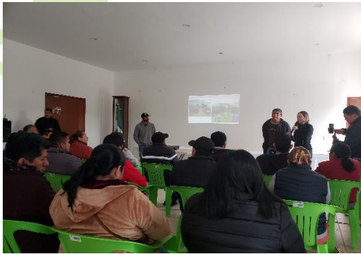
Evidencia 1.- Presentación del Proyecto de Acuaponía.