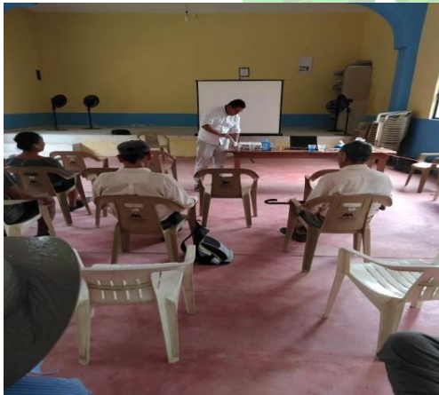
Evidencia 3: Elaboración de productos Agroecológicos en la Comunidad Barrio Arriba.