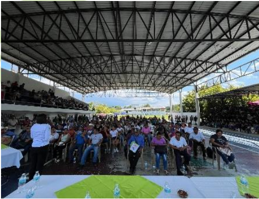
Evidencia 1: Inicio de la capacitación sobre el tema Mi Negocio es Verde.