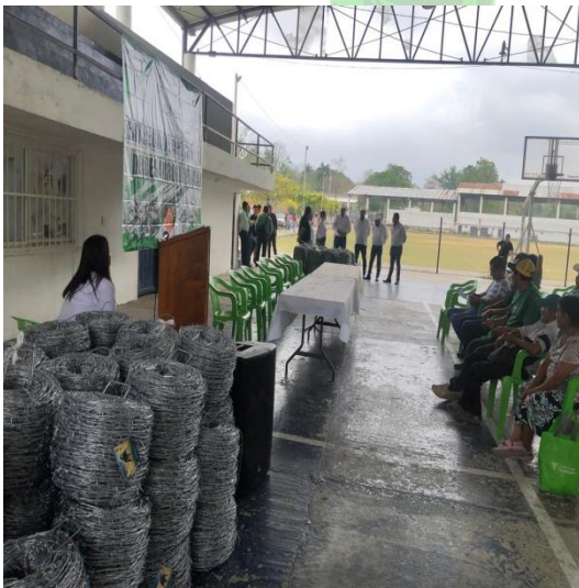
Evidencia 3: Finalización del programa.