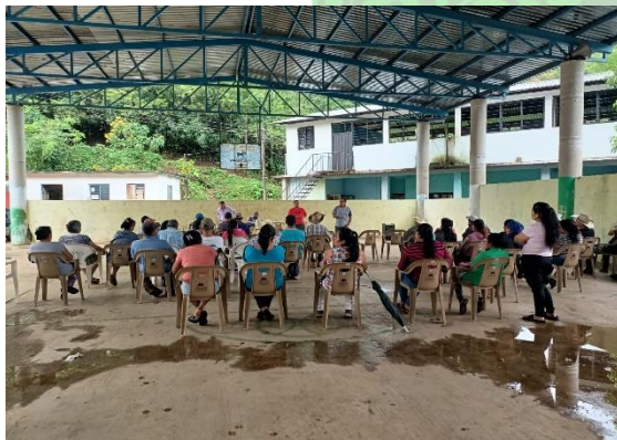
Evidencia 1. - CENSO Agropecuario en Cuaquentla.