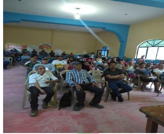
Evidencia 2: Capacitación en la Comunidad Barrio Arriba.