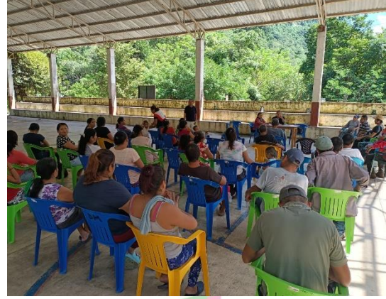
Evidencia 2. – Conformación del Comité de Cítricos en Tlacoahuque.