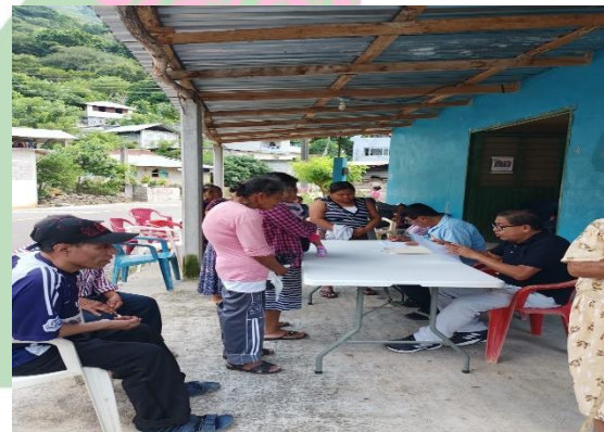
Evidencia 4. - Aplicación Del CENSO Agropecuario en Cuaxilotitla.