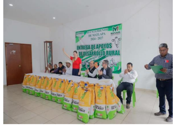
Evidencia 2: Apertura de la entrega de Maíz Certificada.