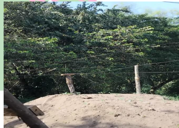
Evidencia 4.- Levantamiento de muros.