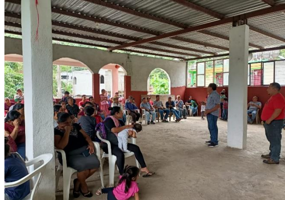
Evidencia 2. - CENSO Agropecuario en Zacayo.