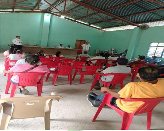
Evidencia 1. – Conformación del Comité de Cítricos en Ahuehuevo 1.