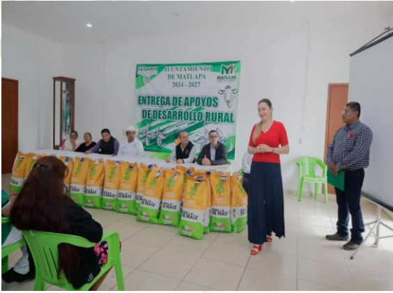
Evidencia 1: Recepción personas beneficiadas y autoridades.