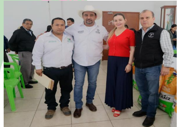
Evidencia 4: Entrega de Semillas a productores del municipio.