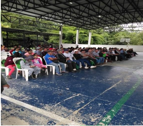
Evidencia 1: Capacitación en Galera Municipal.