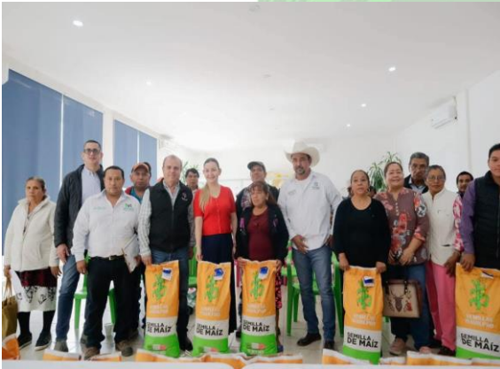
Evidencia 3: Finalización del programa.