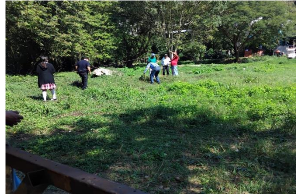
Evidencia 2: Limpia y deshierbe donde se establecerá el vivero.