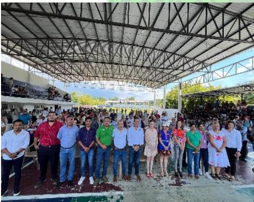
Evidencia 3: Cierre de la Capacitación.