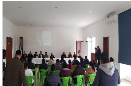
Evidencia 2.- Finalización de la reunión con acuerdos programados.