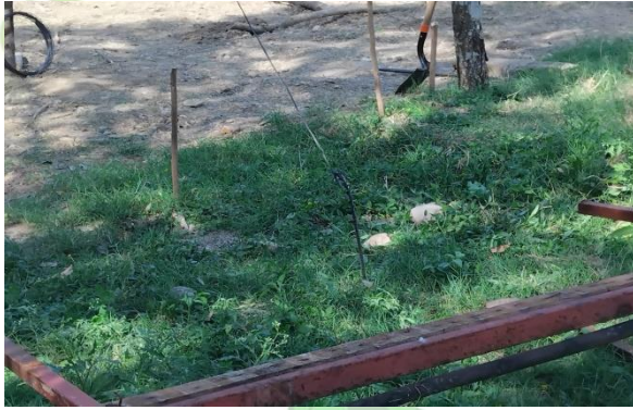
Evidencia 1: Reconocimiento del lugar.