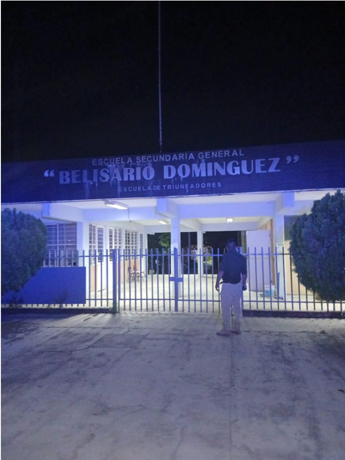
RECORRIDOS Y VIGILANCIA A LAS DIVERSAS ESCUELAS.