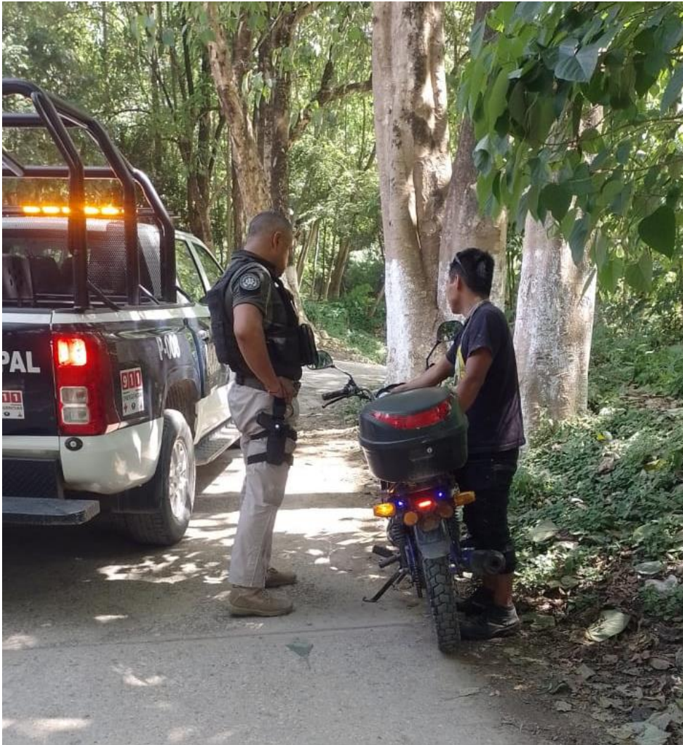
REVISIÓN A MOTOCICLISTAS E INVITACIÓN AL USO ADECUADO DE LOS VEHICULOS MOTORIZADOS A 2,3 Y 4 RUEDAS.