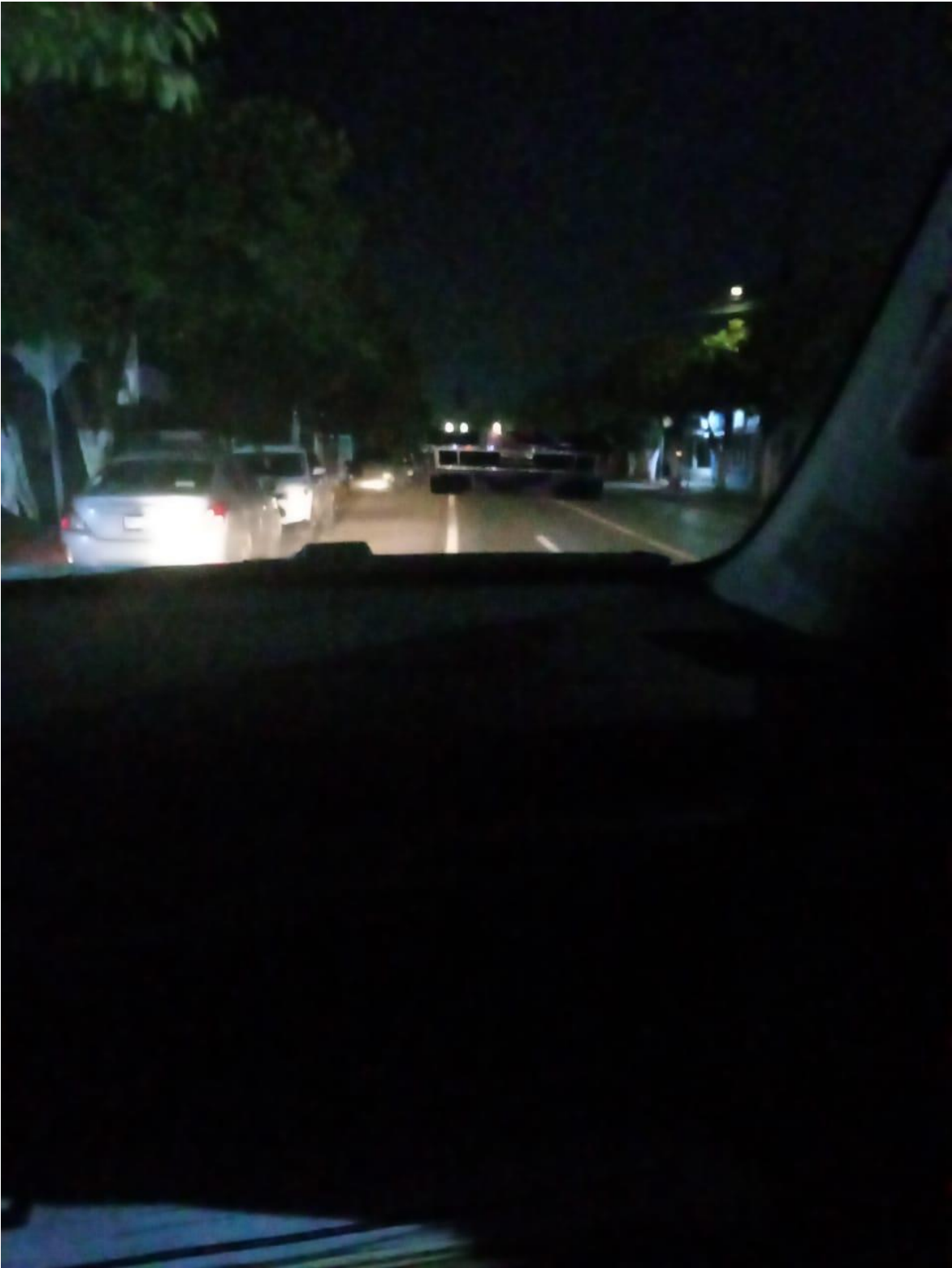
VIGILANCIA NOCTURNA A BORDO DE UNIDAD.