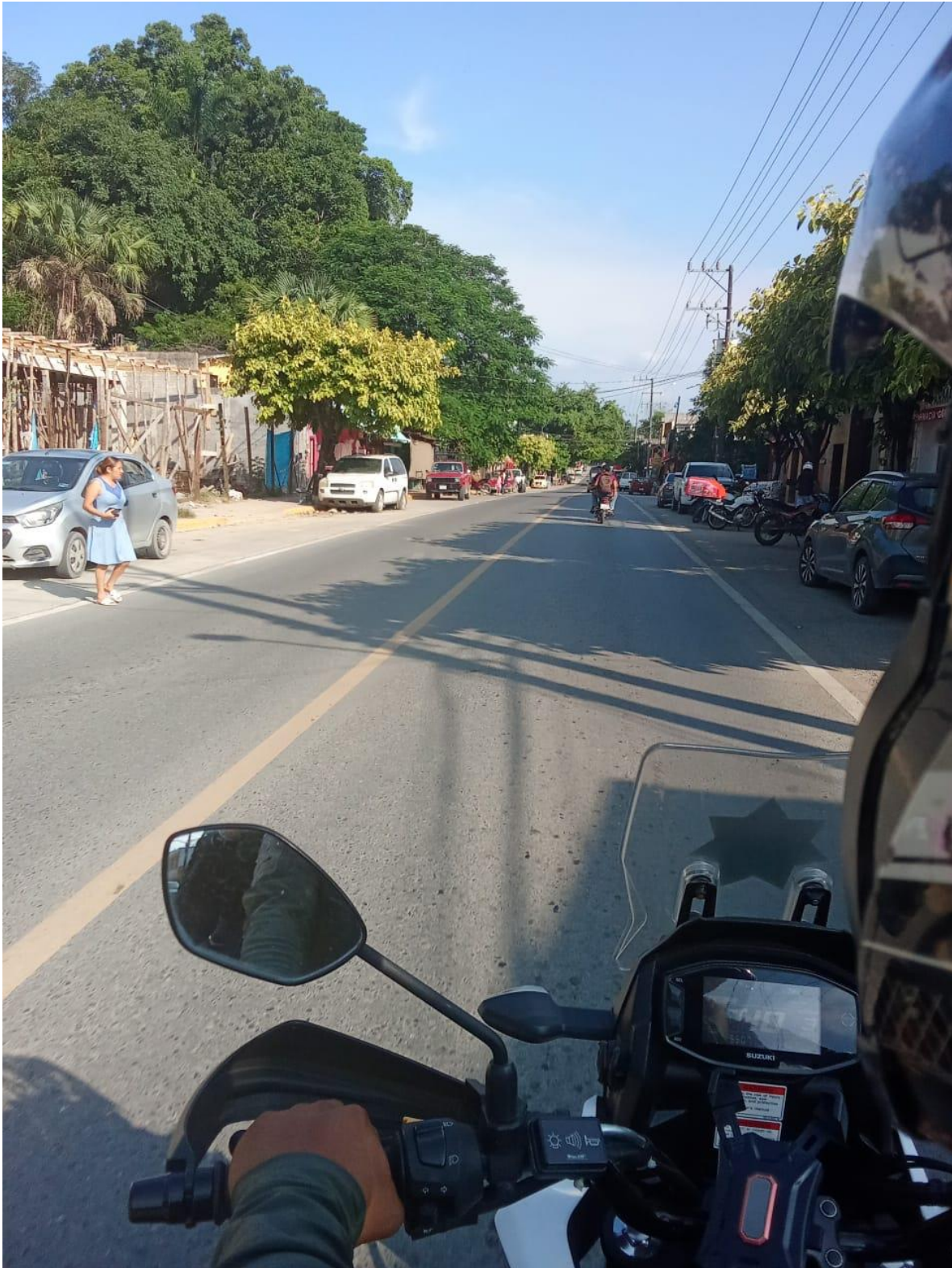
RECORRIDOS DE SEGURIDAD EN MOTO-PATRULLA