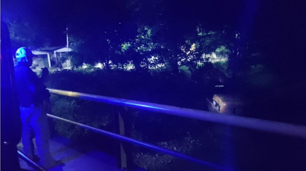
RECORRIDO DE SEGURIDAD Y VIGILANCIA NOCTURNA EN DIVERSOS PUNTOS DEL MUNICIPIO.