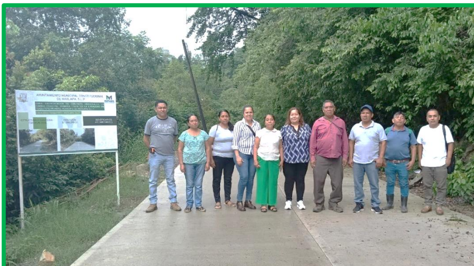
VISITA DE SUPERVISION DE OBRAS REALIZADAS POR CODESOL.