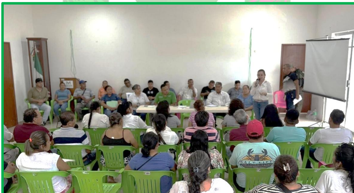
REUNION PRODUCTIVA CON JEFES DE LAS COLONIAS DE LA CABECERA MUNICIPAL.