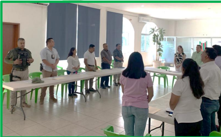
REUNIÓN DE CONSEJO DE SEGURIDAD PÚBLICA MUNICIPAL.