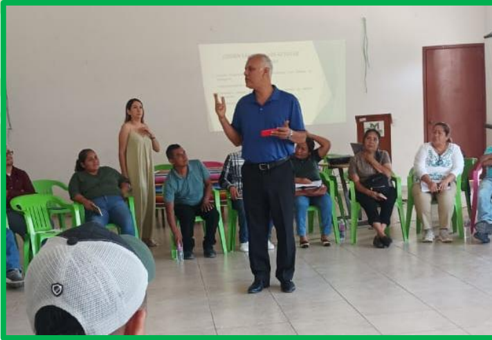
CURSOS DE CAPACITACIÓN Y ADIESTRAMIENTO.