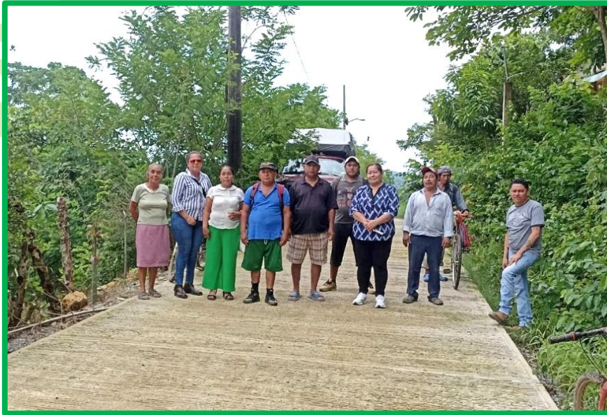
VISITA DE SUPERVISION DE OBRAS REALIZADAS POR CODESOL.