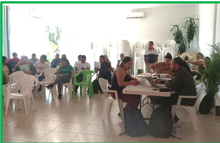
REVISIÓN DE DESEMPEÑO DE LA GUÍA CONSULTIVA.