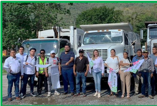
BANDERAZO AL INICIO DE LA TERCERA SEMANA DE SANEAMIENTO BASICO EN EL MUNICIPIO.