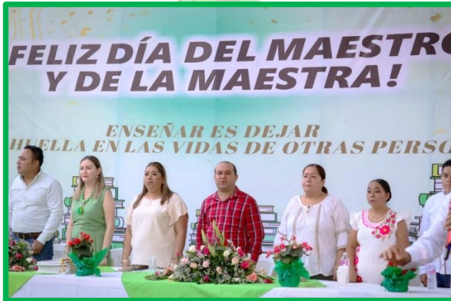
ACOMPAÑAMIENTO EN LA MESA DE HONOR EN EL FESTEJO DEL DIA DEL MAESTRO.