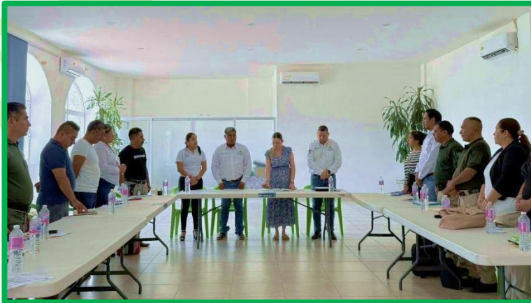
SESIÓN DE CONSEJO MUNICIPAL DE SEGURIDAD PUBLICA.