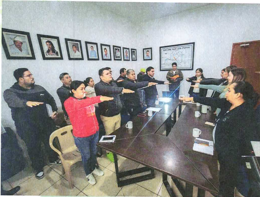
Comité de Salud en Matlapa