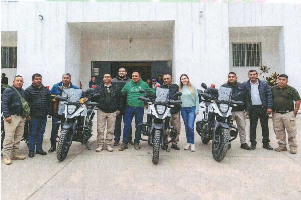
Entrega de moto patrullas para la seguridad de Matlapa