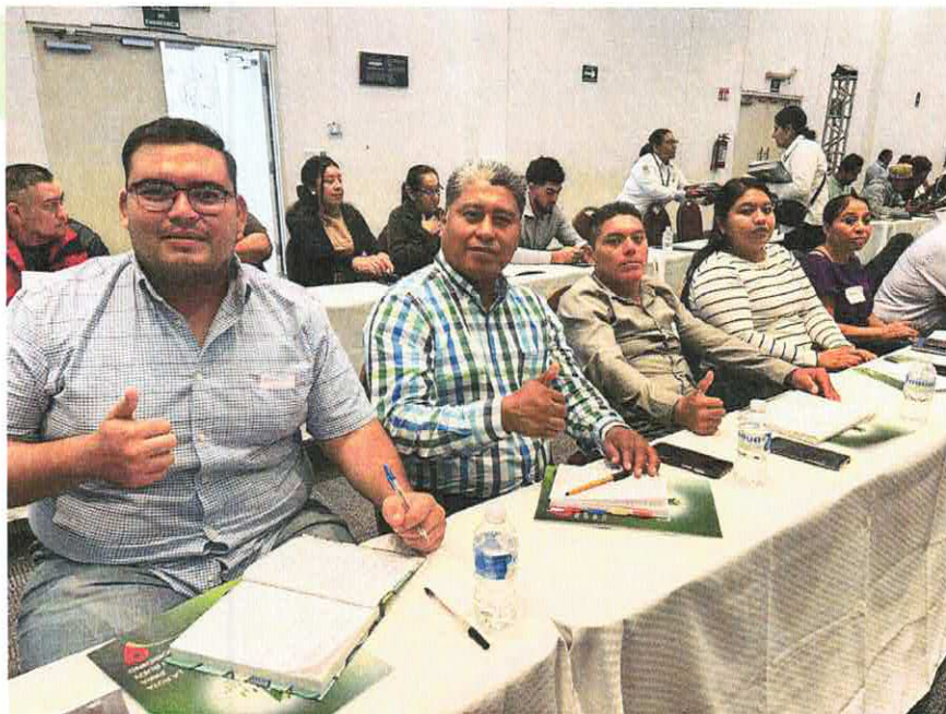
Cursos de capacitación impartidos por la CEFIM del estado presencial y virtual