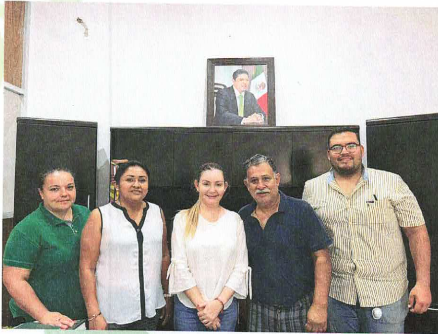
Vínculo entre el gobierno y sus ciudadanos que radican en Monterrey