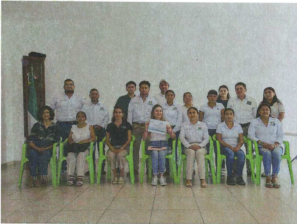
Instalación del grupo municipal para la prevención del embarazo adolescente en coordinación con el Instituto de las Mujeres del Estado