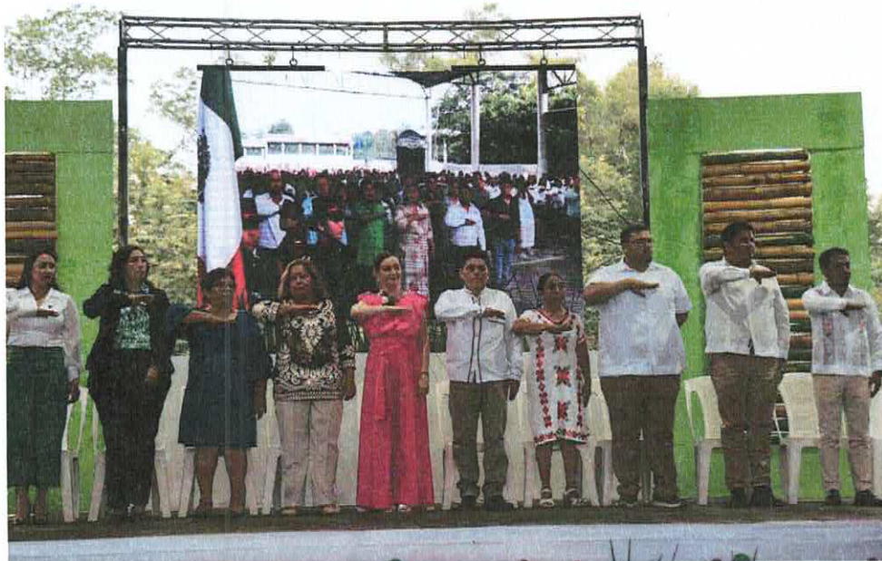
Toma de protesta del Honorable Cabildo 2024-2027