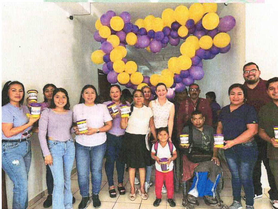
UBRTON 2024 Campaña para recaudar fondos en apoyo a la unidad básica de rehabilitación (UBR)