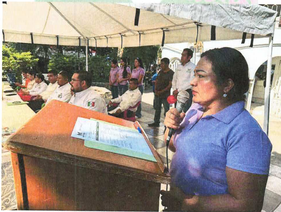
Día Internacional de las Personas con Capacidad