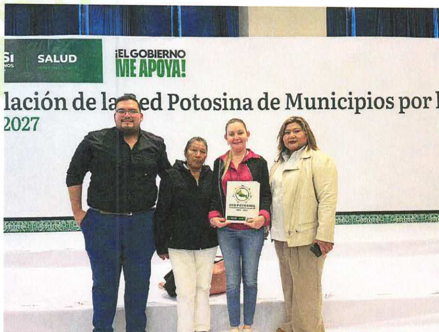
Instalación de la Red Potosina de Municipios por la Salud