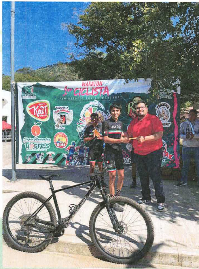
Primer maratón de ciclismo en Matlapa